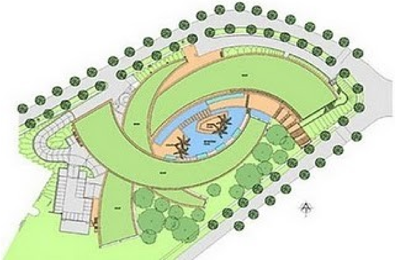
ဒါကတော့ ဒီဇိုင်းအကြမ်းပုံပဲပါ။