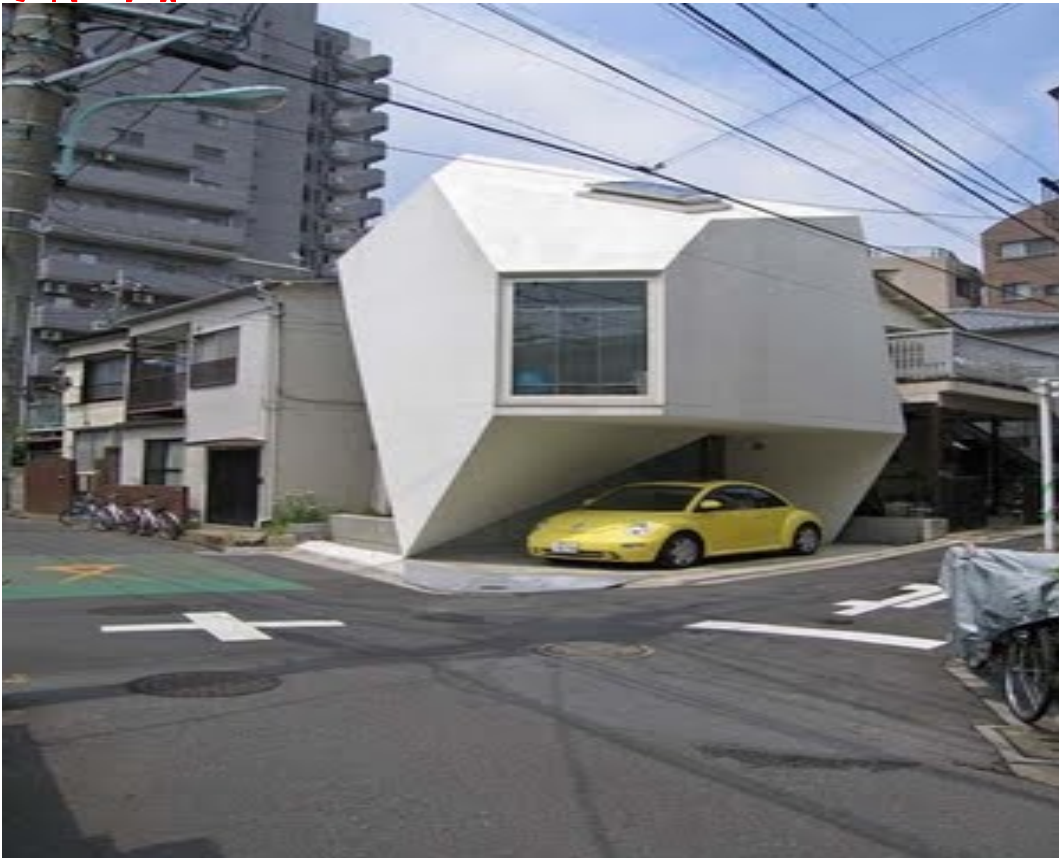
ဂျပန်နိုင်ငံမှာရှိတဲ့ သေးငယ်သော အိမ်ကလေး