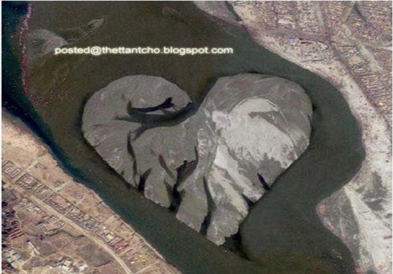
ကုန်းမြေနှစ်ခုကြားက ရေလက်ကြား အသည်းပုံ သဏ္ဍာန် ကျွန်းလေးပဲ ဖြစ်ပါတယ် ။