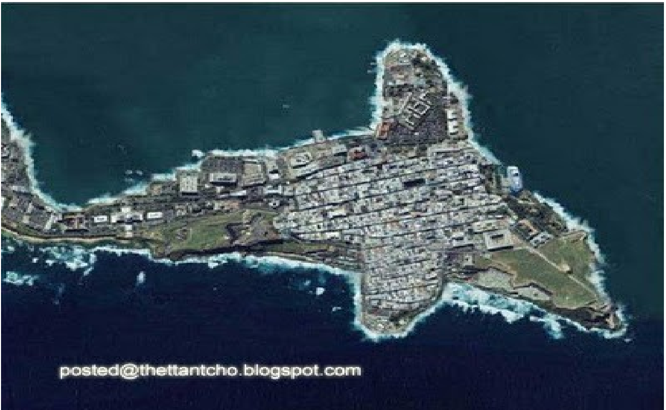
ဒါကတော့ လူတွေ ပြုလုပ်ဖန်တီးထားတဲ့ ငါးကျွန်းလို့ အမည်ရတဲ့ ကျွန်းဆွယ်ကို ဝေဟင်ကနေ ရိုက်ကူးထား ခြင်းပဲ ဖြစ်ပါတယ် ။