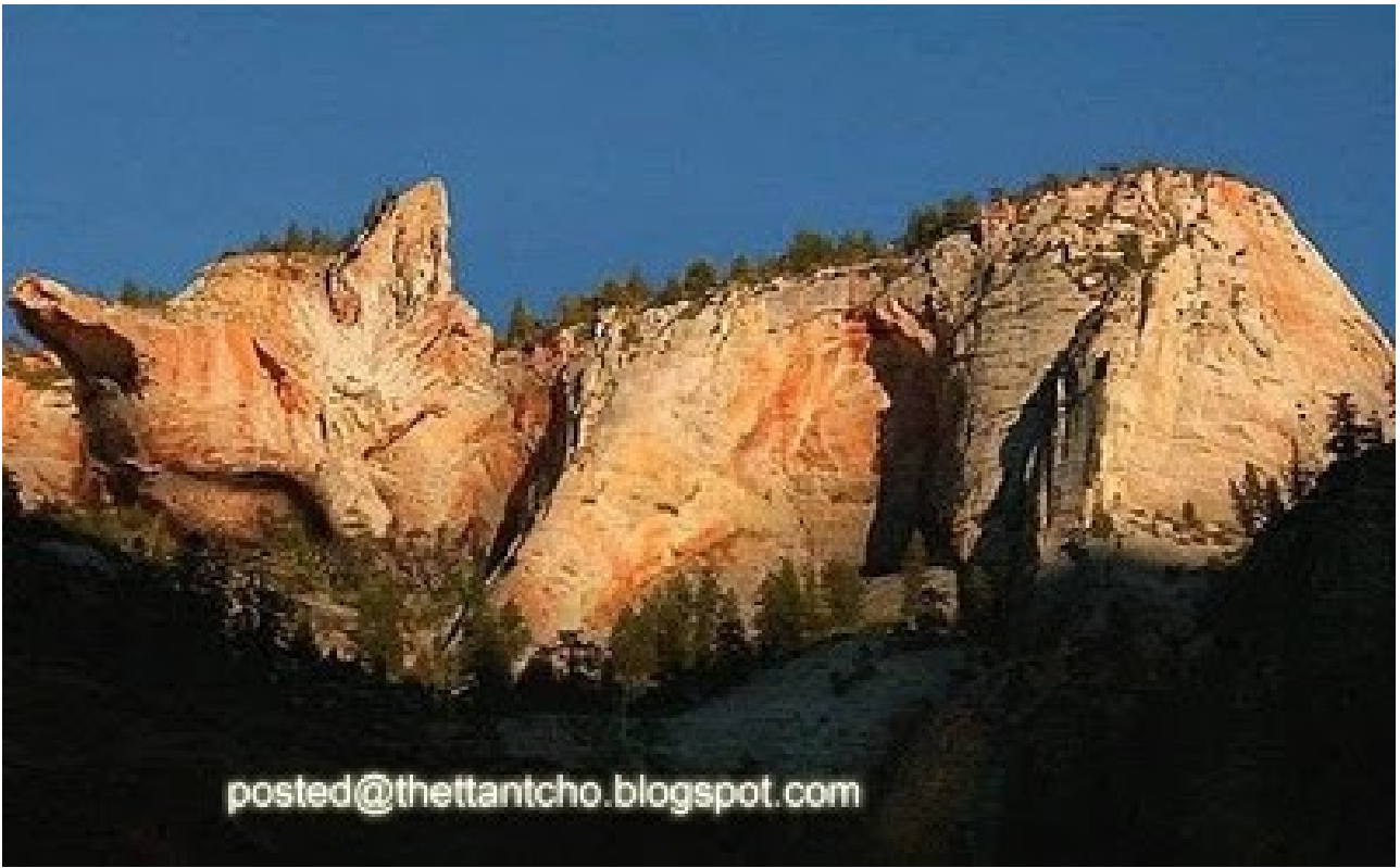
ကြောင် (သို့မဟုတ် ) မြေခွေး သဏ္ဍာန်ရှိတဲ့ တောင်တန်းတစ်နေရာ ဖြစ်ပါတယ် ။