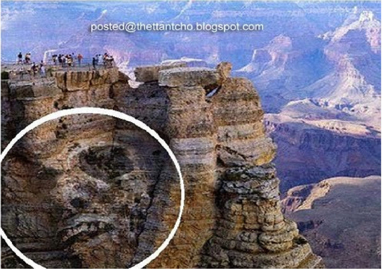
လူဦးခေါင်း သဏ္ဍာန်ရှိတဲ့ တောင် မျက်နှာပြင်တစ်နေရာ ဖြစ်ပါတယ် ။