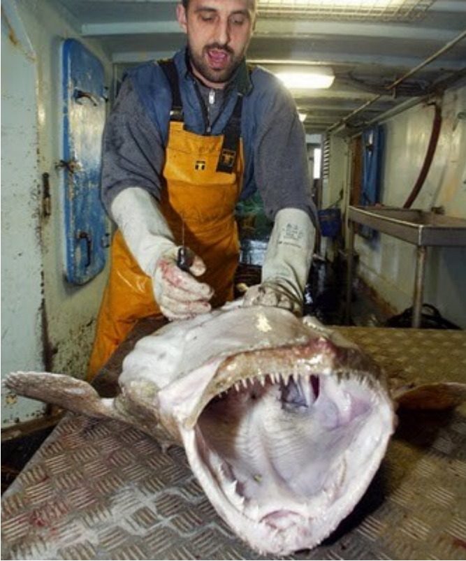
ဒီကောင်ကတော့ ချွန်မြတဲ့သွားတွေပါရှိပြီး ပင်လယ်ရေနက်ကြမ်းပြင်မှာ ကျက်စားလေ့ရှိပြီး ကြောက်မက်စရာ ဒီဇါး ကို Anglerfish လို့ခေါ်ကြပါတယ်။