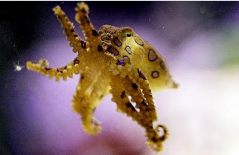
အရွယ်အစားကတော့ ဂေါ်ဖ် ဘောလုံးစာလောက်ပဲ ရှိပေမယ့် ဒီကောင်က အမှန်တကယ်ပဲ အဆိပ်ပြင်းတဲ့ သတ္တဝါ ဖြစ်ပါတယ် ။ သူ့ရစ်ခြစ်ရာလေးတစ်ခုက လူတစ်ယောက်ကို သေစေနိုင်ပြီး ယခုချိန်ထိ ဖြေဆေး မရှိသေး ပါဘူး ။