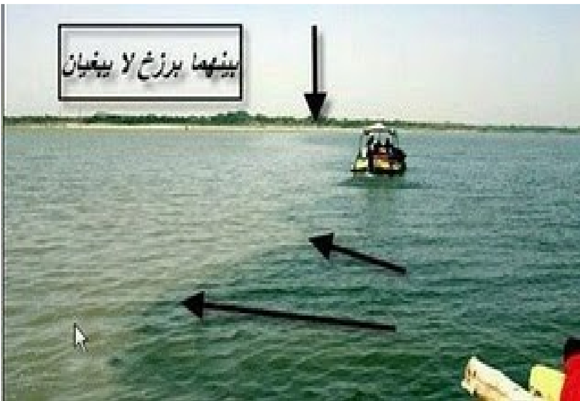
အပေါ်က ပုံနှစ်ပုံဟာ တောင်အာဖရိက Cape Town အနီးက တောင်ဖက် အစွန်ပိုင်းမှာ