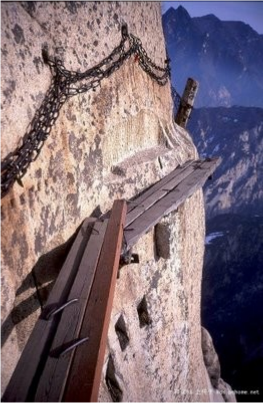
ဒီလမ်းကြောင်းလေးကနေသွားကြရမှာနော်... ။